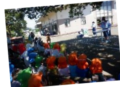
夏のあそび満喫中(o^-^o)